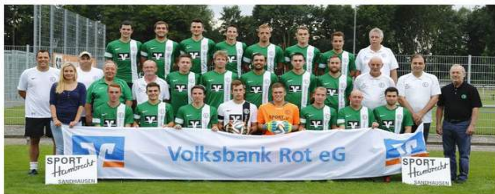
2015-2016 FC Rot Kreisliga HD